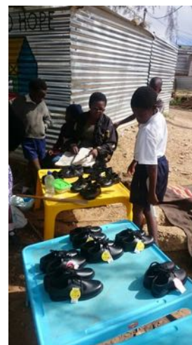
De nieuwe schoenen worden gepast