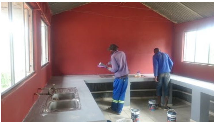
Het opknappen van de keuken is bijna klaar. De apparatuur kan worden geplaatst

Vooruitlopend op een definitieve oplossing voor het ruimtegebrek zijn diverse creatieve ideeën uitgewerkt en gerealiseerd. Zo is op de grond waarop het toekomstige MFC gebouwd wordt inmiddels een optie genomen. Enkele containers en een hekwerk zijn geplaatst. Helaas heeft het gemeentebestuur nog geen definitief besluit over de grondverwerving genomen. Om de situatie ter plekke nu al te verbeteren is samenwerking gezocht met de (toevallig ook Nederlandse) stichting Penduka. Bij deze organisatie wordt een ruimte gehuurd die gebruikt kan worden om te koken. Inmiddels is deze keuken opgeknapt en kan er in een hygiënische omgeving voor de kinderen gekookt worden.