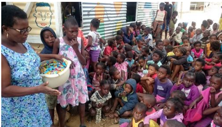
Met Pasen kregen de kinderen een 'echte' traktatie

Financieel was 2017 een succesvol jaar. De doelstellingen van de Stichting en de noodzaak om te helpen worden bij steeds meer mensen bekend. Dit resulteerde begin 2017 in een verhoging van het maandelijkse sponsorbedrag voor voeding van 500 naar 600 euro.